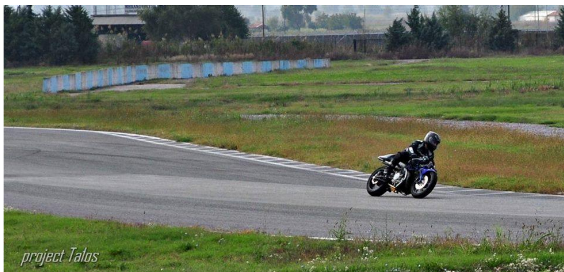
Το Project Talos σε δοκιμή στην πίστα του Αυτοκινητοδρομίου Σερρών